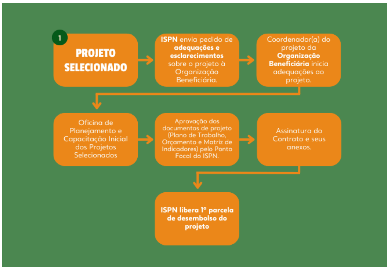
Fluxograma do processo de contratação e pagamento da 1ª parcela do projeto

As parcelas subsequentes são repassadas, mediante apresentação do relatório do projeto com informações sobre as atividades realizadas e o recurso aplicado.