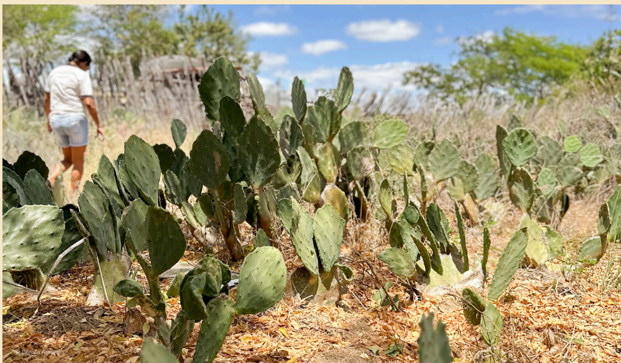
O Fundo Ecos atua no bioma Caatinga, além de Amazônia e Cerrado

Ao completar 30 anos de existência em 2024, consolidando-se como fundo independente essencial para a execução da estratégia do ISPN, o mecanismo passa a ser chamado de Fundo Ecos . Com novo nome, o funcionamento continua o mesmo, respeitando os modos de vida tradicionais e locais, impulsionando lideranças e com pé no chão dos territórios .