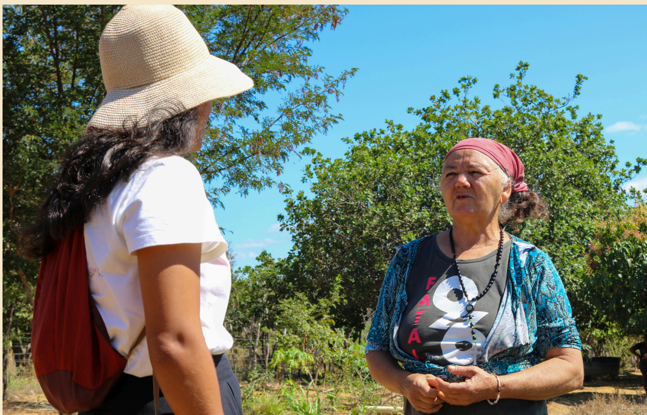
Respeito à diversidade e transparência são aspectos fundamentais da comunicação comunitária