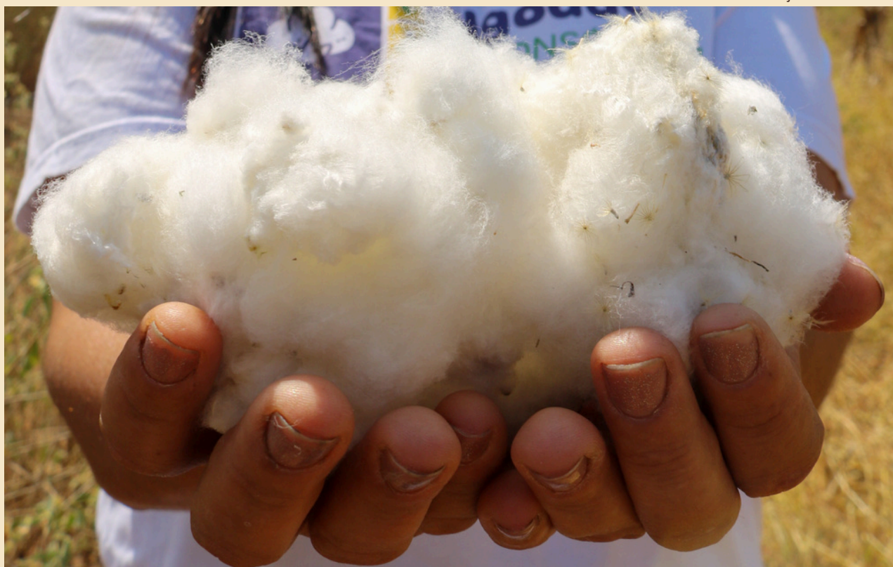
Algodão agroecológico é uma das economias da sociobiodiversidade apoiadas pelo Fundo Ecos

Apoiar um projeto ecossocial, promovendo iniciativas integradas, como acesso a conhecimentos, capacitações, articulações de parcerias nos territórios e influência em políticas públicas (advocacy) , contribui para o fortalecimento de organizações comunitárias.