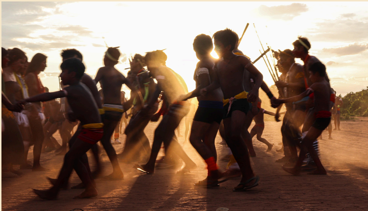
Povo Kisê'djê, aldeia Krikati, Xingu, celebra conquista de casa do pequi com apoio do Fundo Ecos