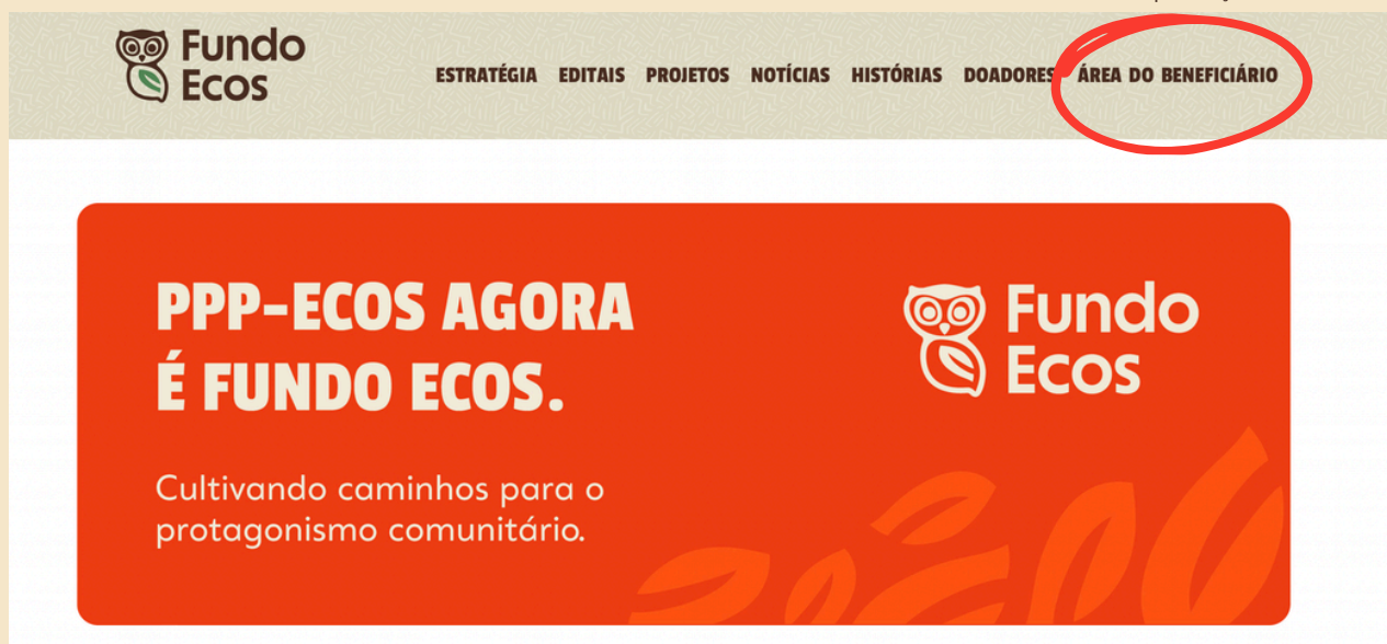
Página inicial do site Fundo Ecos com destaque para a aba 'Área do beneficiário'

Os apoiadores do 45º edital Fundo Ecos são o Fundo Global para o Meio Ambiente (GEF), Small Grant Programme (SGP) e o Programa Nações Unidas para o Desenvolvimento (PNUD). A barra de logos a ser utilizada está em "Projetos GEF 8 (Cerrado e Caatinga)".