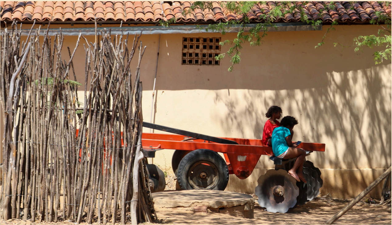
É importante evitar fotografia com rosto de crianças