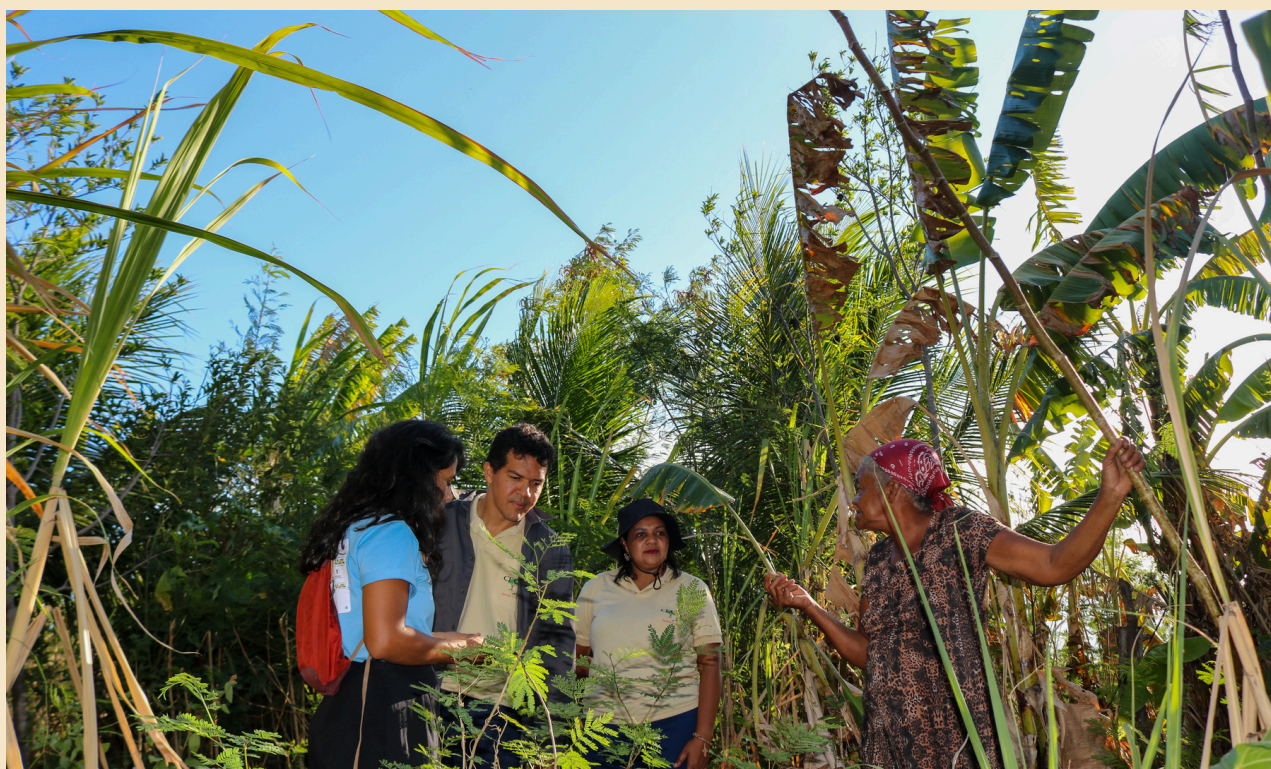
Monitoramento de projeto (GEF/PNUD) no Sertão do Pajeú realizada pela equipe técnica do ISPN

A partir de 2013 , o PPP-ECOS passou a atuar na Caatinga , ainda com apoio do GEF, e ampliou suas fontes de financiamento, com recurso do Fundo Amazônia/BNDES. Com isso, o programa aumentou sua área de atuação para três estados do bioma Amazônia: Maranhão, Mato Grosso e Tocantins .