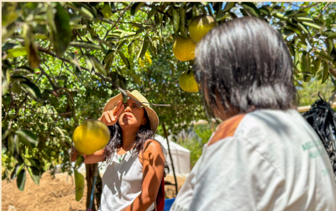
Equipe do ISPN monitora projeto (GEF/Pnud) na comunidade Bom Sucesso, Sertão do Pajeú