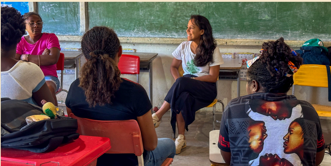
Comunicação entre equipe do ISPN e beneficiários é fundamental a uma boa execução do projeto

A comunicação está presente em todos os lugares: novelas, propagandas, músicas, filmes. Ela possui um enorme poder de persuasão . E, longe de ser neutra, sempre reflete uma visão de mundo específica, o que significa que toda comunicação tem um lado.